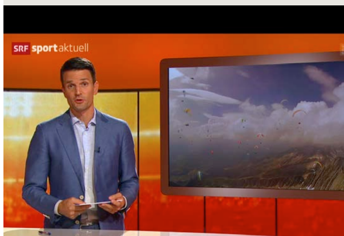
Bild- und Videomaterial wird von uns selbst erstellt und die Medienberichte verfasst unser Medienbeauftragte Renato Barnetta, freier Journalist BR und ebenfalls Gleitschirmpilot. Dank dieser Struktur können wir im Falle eines Unfalls zurückhaltend und sachlich berichten.

Die Sicherheit hat höchste Priorität. Dies setzen wir in erster Linie um, indem wir die Flugrouten sehr genau den Wetterverhältnissen anpassen und Stuarts am Boden und in der Luft laufend Feedbacks zu den Wetterkonditionen geben. Im Zweifelsfall kann eine Flugaufgabe innert Minuten gestoppt werden (die Piloten erhalten dann die Punkte bis zu diesem Zeitpunkt).